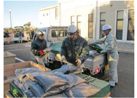
昨年11月の配布では、多数の方から申込みが有り、大変盛況でした。